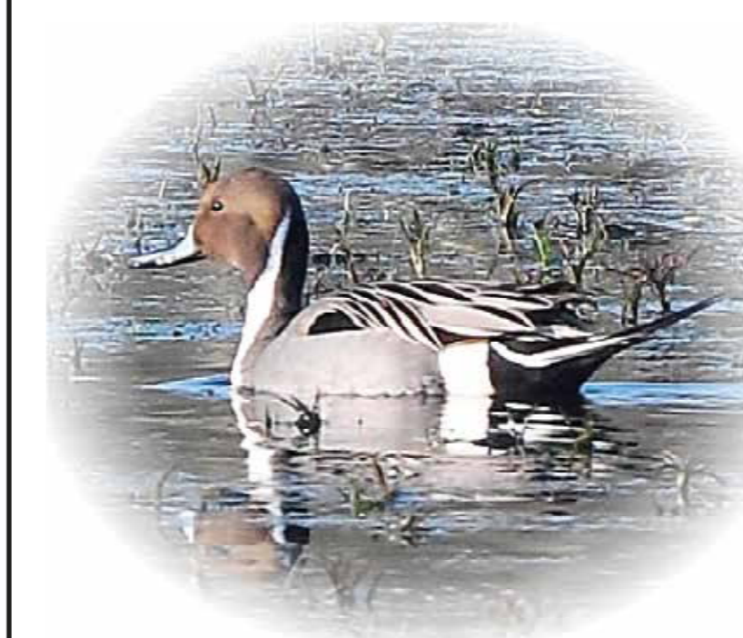
Canard pilet Anas acuta