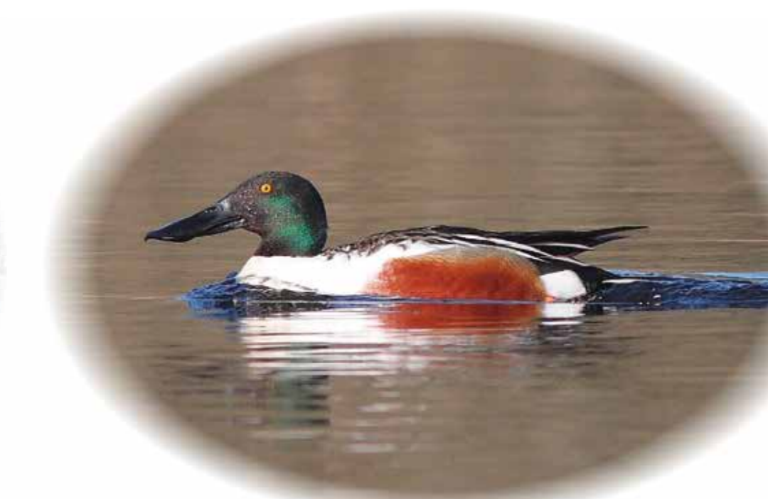
Canard souchet Anas clypeata