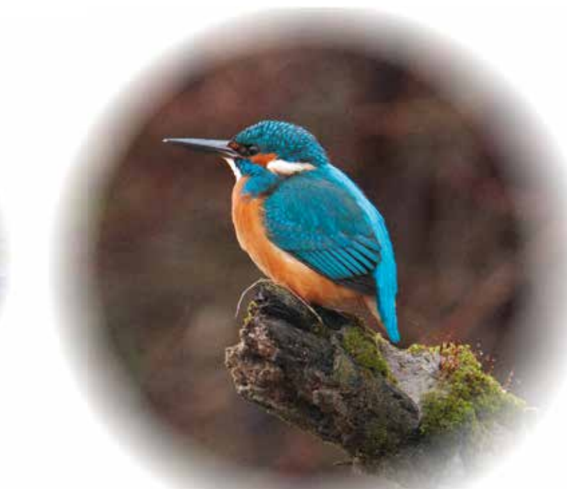
Martin pêcheur Alcedo atthis

Pour pouvoir pratiquer la pêche sur ce parcours, vous devez être muni d'une carte de pêche d'une AAPPMA (Association Agréée pour la Pêche et la Protection du Milieu Aquatique). Vous pouvez vous en procurer une chez les dépositaires de l'AAPPMA de "Mansigné" ou par le biais du site internet www.cartedepeche.fr .