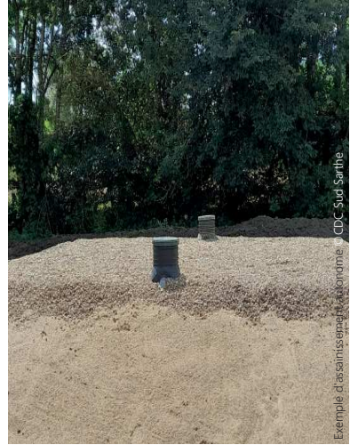
Exemple d'assainissement économique - CDC Sud Sarthe