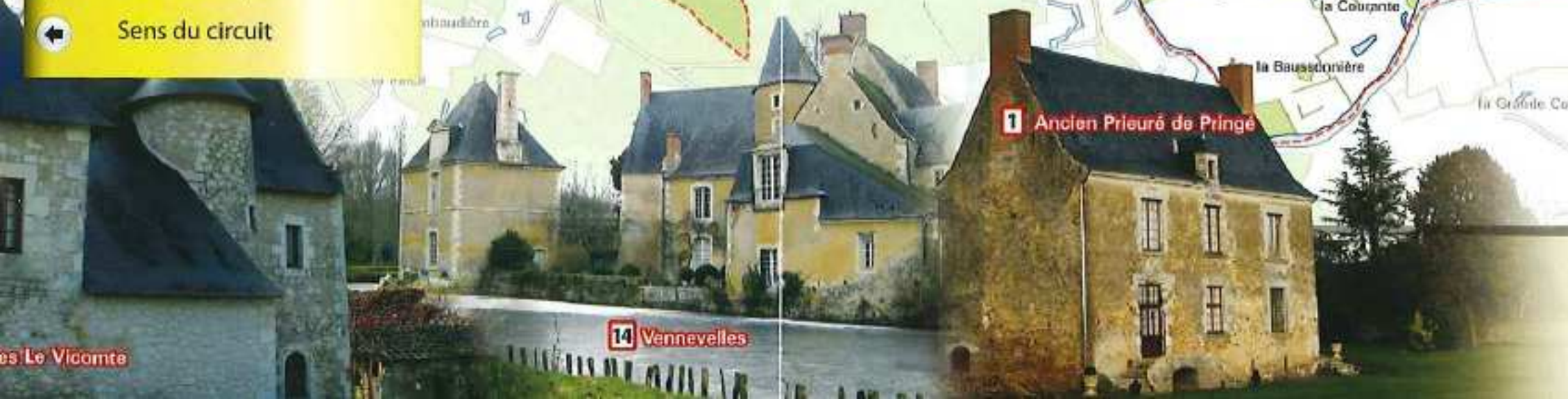
1 Ancien Prieuré de Pringé