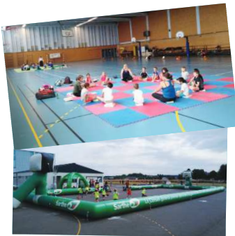
"Sport" devrait revenir en Sud Sarthe à l'été 2020, sans doute sur un nouveau site.

Après Mansigné en 2018, "Cet été la Sarthe, Destination Sport" a fait étape à Mayet, le 11 juillet dernier, rassemblant près de 130 enfants. Organisé par le Comité Départemental Olympique et Sportif de la Sarthe, avec le soutien des services communautaires et du Conseil Départemental, cet événement proposait des initiations à de nombreux sports, en partenariat avec plusieurs associations sportives du territoire (club de basket de Mansigné, Rand'Aune et Loir, etc.). De plus, plusieurs sportifs de haut niveau, dont un champion de triple saut de niveau européen et plusieurs espoirs du département, étaient présents pour rencontrer les jeunes et contribuer à promouvoir le sport sarthois. Au vu du succès obtenu, "Cet été la Sarthe, Destination